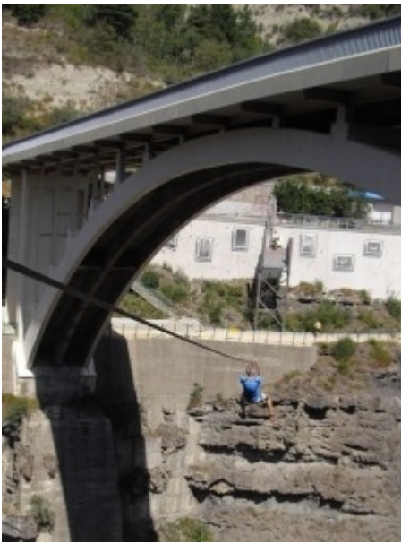
le grand saut

Juste après la tyrolienne, il y a une petite épreuve de Canoë Sprint, 300m-400m peut-être. On s'en sort assez bien malgré quelque petite contracture au jambes pour le père. Le dernier kilomètre qui nous ramène au départ est horriblement raid dans un chemin où il faut pousser le vélo. Il fait très chaud maintenant et mes manches longues sont dures à supporter. Nous posons enfin les vélos et partons pour 20km de Trail orientation. L'organisation a supprimé deux balises compte tenu du temps mis par les dernière équipe pour rejoindre la tyrolienne. Le début est très raid, sur un chemin en lacets. Pendant le chemin offre de beau point de vue sur corps, le lac et l'Obiou.