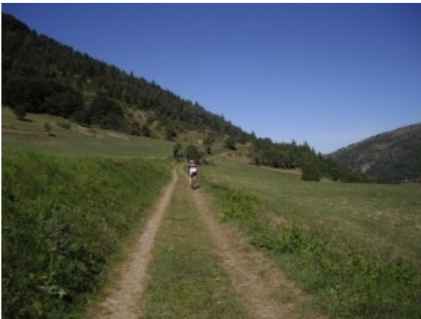
autre type de chemin, après le CP4