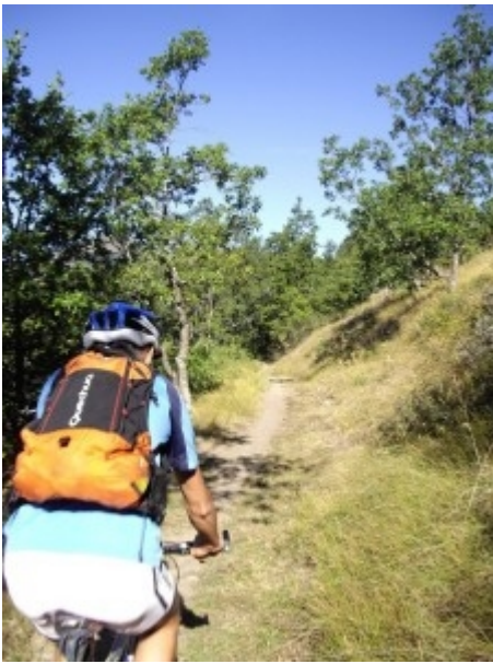
petit chemin sympa