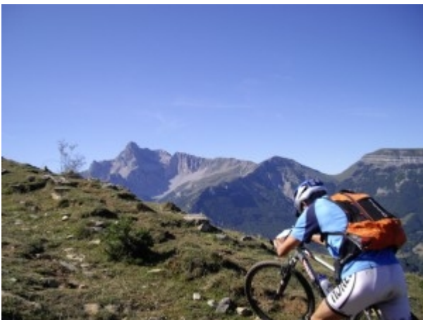
vue sur l'Obiou

Les Royans et l'équipe 32 d'Esprit Dahu nous ont doublé assez rapidement, mais ce sont les seuls à avoir eut un rythme nettement supérieur au notre. Nous côtoyons plusieurs équipes, on roule ensemble sur plusieurs centaines de mètres souvent, et on les double doucement, au grès des difficultés et des poses.